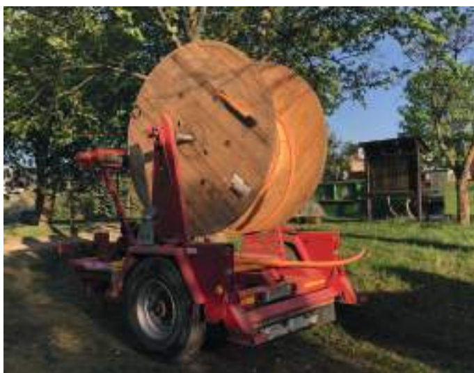
Kabeltrommeln bringen Glasfaser-Infrastruktur ins Land.

Beim Ausbau seiner Infrastruktur hat Deutschland riesigen Nachholbedarf. Seien es Starkstromtrassen, die Windstrom von der Küste ins Binnenland bringen, seien es Brücken, die Zügen, Lkw und Pkw den Weg bahnen oder Strom- und Glasfaserleitungen für eine verbesserte Digitalisierung: Überall werden Kabel und Seile benötigt. Damit die auf den Baustellen zur richtigen Zeit in der Luft hängen oder im Boden liegen, gibt es Seil- und Kabeltrommeln. Und die sind meist aus Deutschlands wichtigstem nachwachsenden Rohstoff: Holz.